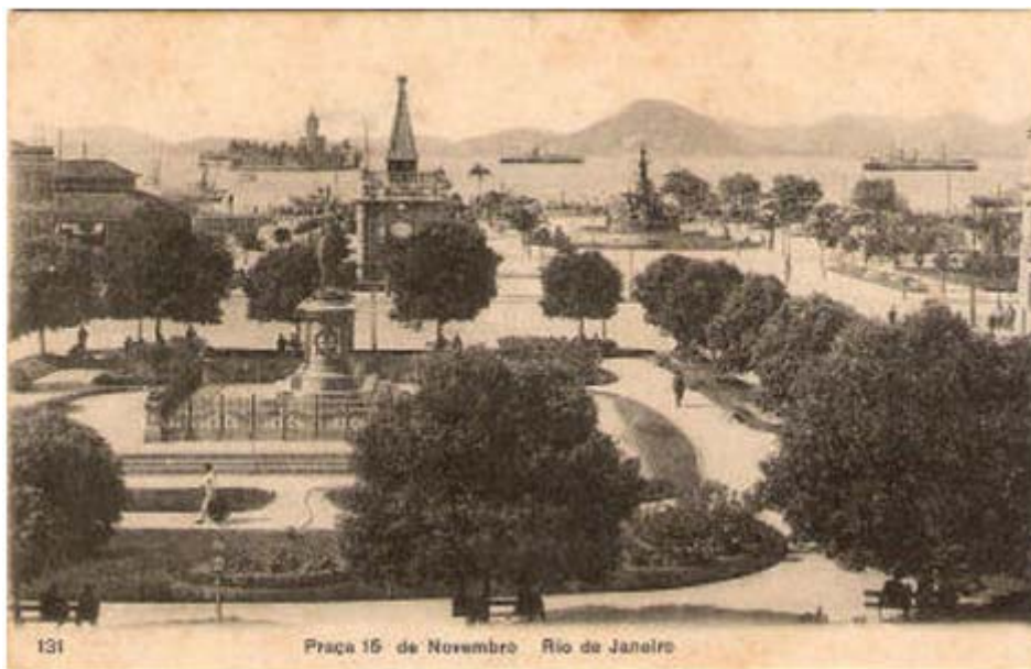
Praça XV de Novembro – Início do século passado.

Quem sabe um dia o povo acorde e permita que o Rio de Janeiro volte a ser a versão moderna da Cidade Maravilhosa de Pereira Passos?