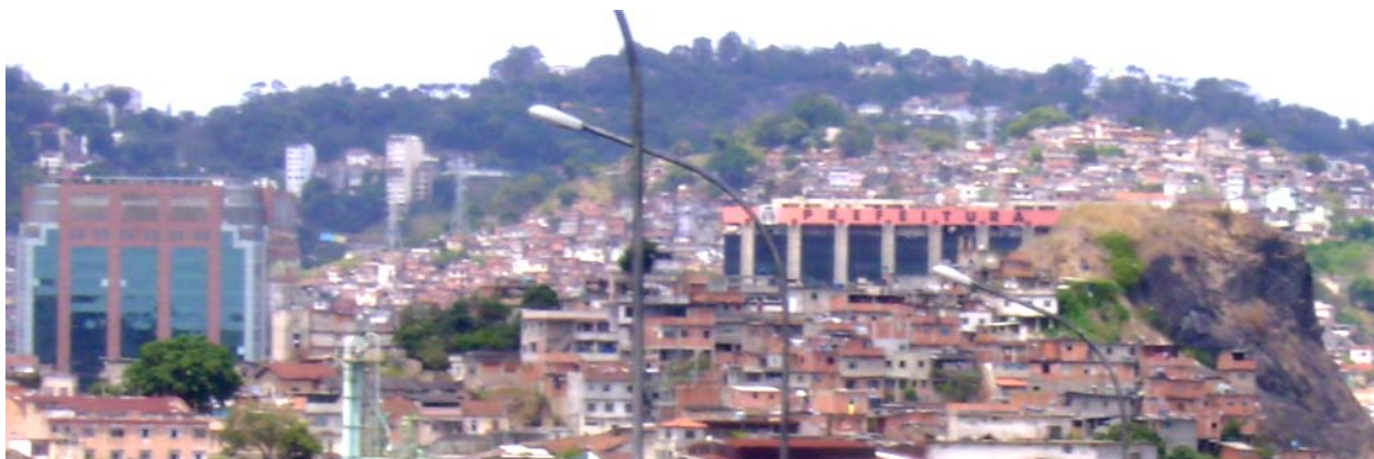
Vista panorâmica da chegada à Cidade Maravilhosa.

Tiroteio em favelas e arredores já não é novidade há mais de uma década na cidade Rio de Janeiro.