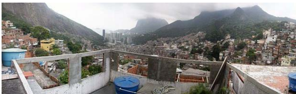
Vista panorâmica da Rocinha.

Floriano P. Faria Lima Chagas Freitas Leonel Brizola Moreira Franco Nilo Batista Marcello Alencar Anthony Garotinho Benedita da Silva Rosinha Garotinho Sérgio Cabral Filho