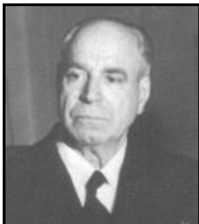
Vice Almirante Álvaro Alberto da Motta e Silva

A Usina Termonuclear Angra III talvez seja o exemplo mais representativo do desgoverno e da inexistência de políticas públicas consistentes que transcendam medíocres políticas de governo.